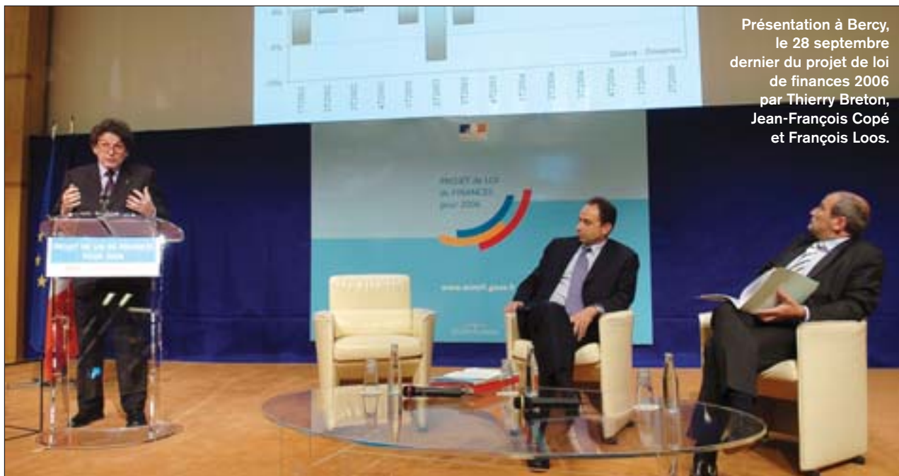
Présentation à Bercy, le 28 septembre dernier du projet de loi de finances 2006 par Thierry Breton, Jean-François Copé et François Loos.