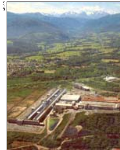
Une réunion de travail sur la reconversion du site Alcan de Lannemezan se tiendra avant la fin de l'année 2006.

tement d'examen des problèmes de financement des entreprises). Composés des représentants des services territoriaux de l'Etat concernés, ils ont pour mission de trouver une solution de redressement susceptible de convenir aussi bien aux actionnaires, aux établissements financiers, aux principaux clients et aux créanciers publics intéressés par la survie des entreprises en difficulté. Quant aux dossiers traitant des grandes entreprises de dimension nationale ou internationale, ils restent de la compétence du Ciri (Comité interministériel pour les restructurations industrielles), un organisme rattaché à la DGTPE (Direction