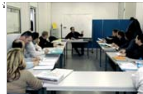
Les contrats du site sont signés par l'Etat, les élus locaux et les entreprises en restructuration.

C'est un séminaire de travail important qui a rassemblé le 26 avril dernier à Paris nombre de représentants des services de l'Etat compétents dans le domaine économique. Consacré au thème de l'accompagnement public des mutations industrielles qui frappent de nombreuses régions françaises, il a permis de réaffirmer de manière forte la politique conduite par le gouvernement en la matière depuis quelque temps. « Compte tenu de la rapidité actuelle des évolutions technologiques, a rappelé ce jour-là Laurent Fiscus, directeur du pôle en charge de ce dossier au sein de la Diact (Délégation interministérielle à l'aménagement et la compétitivité des territoires), il est indispensable de renforcer nos capacités d'anticipation économique et de privilégier une approche dynamique de la compétitivité. » D'où la généralisation du système dit des contrats