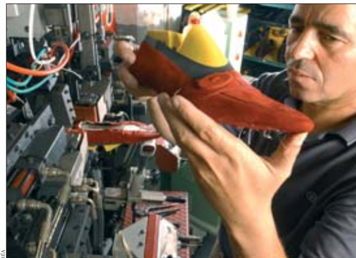
A Romans, un contrat de site a été signé au printemps dernier.

positif devrait permettre à notre pays de conserver son rang de grande puissance industrielle dans le monde. Car si la France subit régulièrement des crises graves dans certains bassins de mono industries ou d'industries traditionnelles (tous les secteurs sont aujourd'hui confrontés à des mutations technologiques importantes induites par la concurrence internationale), elle n'est pas aujourd'hui face à un phénomène global de désindustrialisation : l'industrie y occupe en effet encore environ 20 % du nombre total des emplois du pays. Un pourcentage relativement élevé pour les pays développés. ■