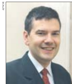
Olivier Peyrat, directeur général de l'Agence française de normalisation.

Ainsi, pour tenir compte de la mondialisation croissante des marchés, Afnor est bien décidée à promouvoir activement les positions françaises dans l'élaboration des futures normes européennes et internationales. Conseils d'administration, comités